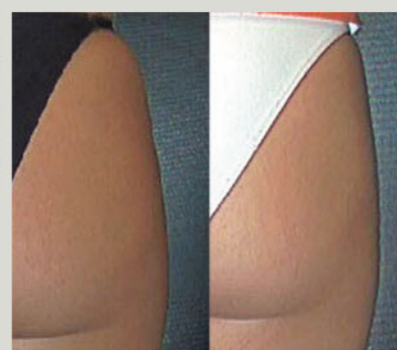
Architetto, 28 anni