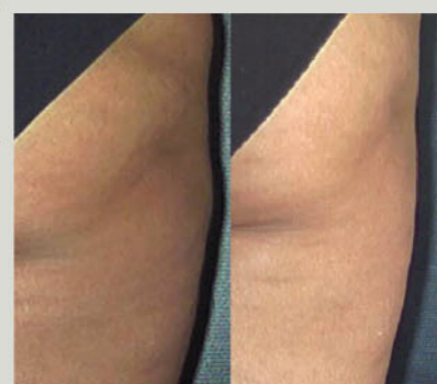
Parrucchiera, 44 anni