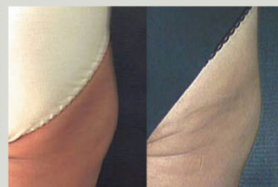
Estetista, 53 anni