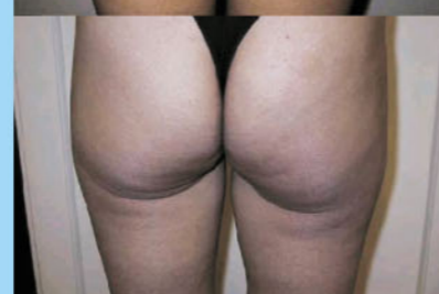
Prima e dopo della terapia con Dermoelettroporazione®